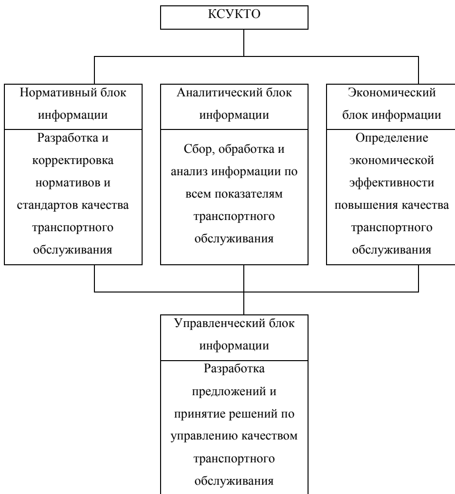
Рисунок 2.7. – Структура информационной системы менеджмента качества транспортного обслуживания