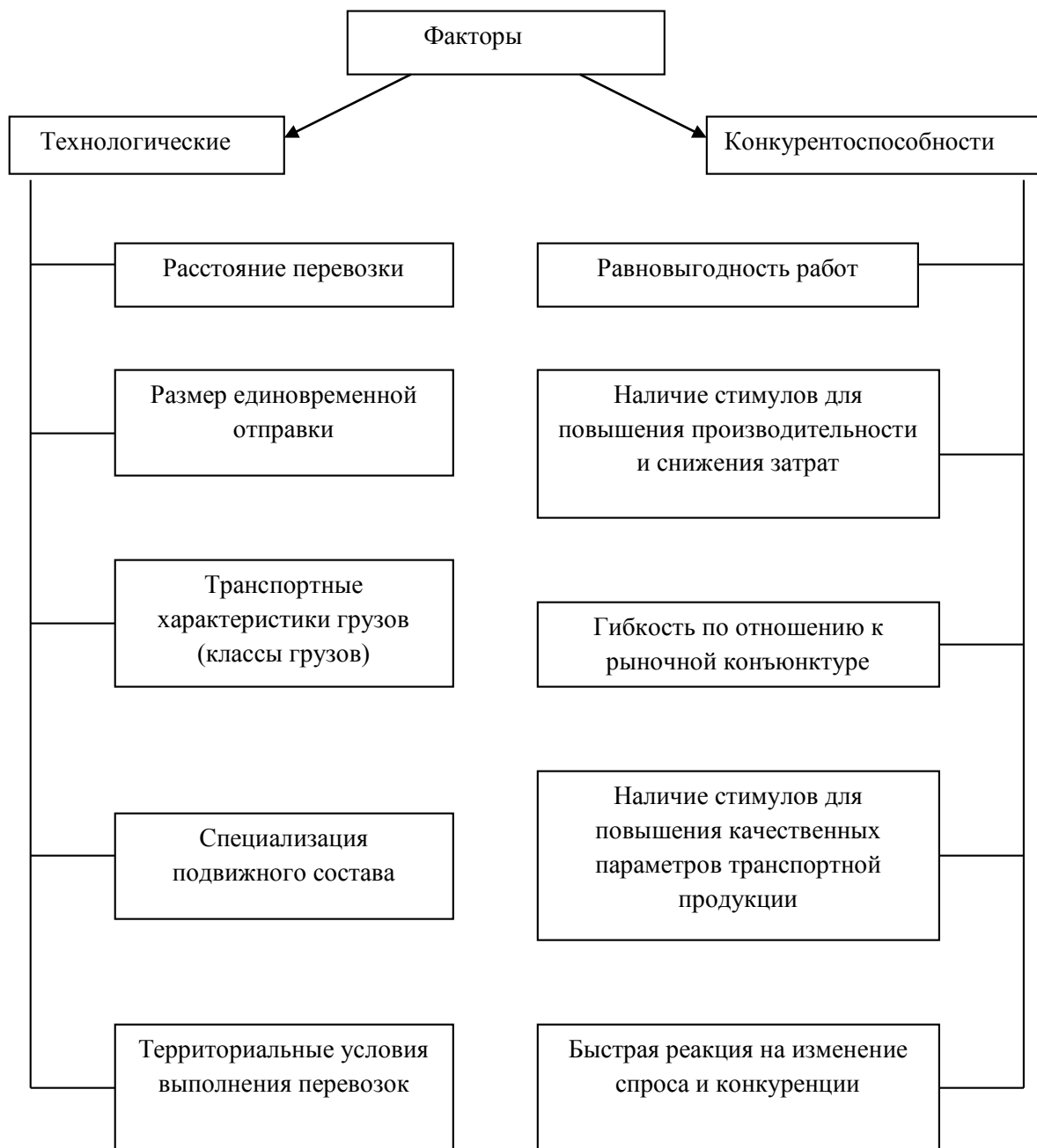
Рисунок – 2.7. Факторы, характеризующие принципы построения тарифных систем на транспорте