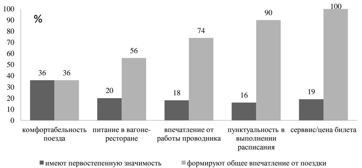
Рисунок – 3.3. Факторы, формирующие общее впечатление от поездки в поезде