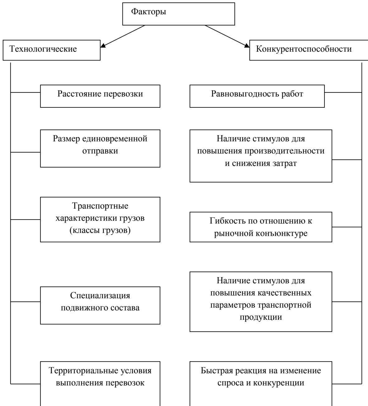
Рисунок 2.7. – Факторы, характеризующие принципы построения тарифных систем на транспорте